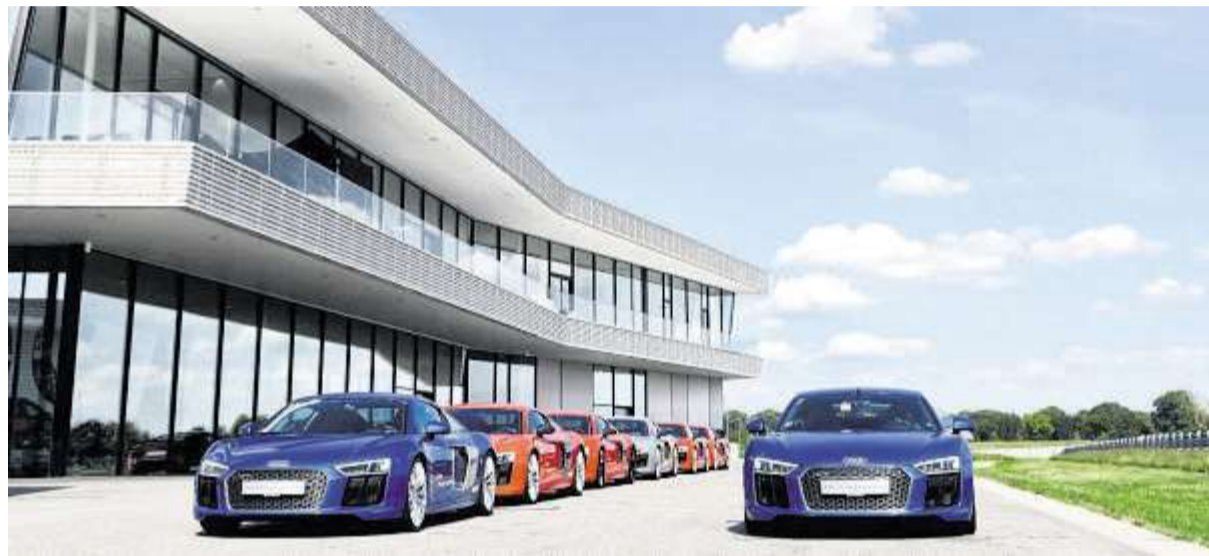
Zum Einsteigen bereit: die beeindruckende Flotte der Audi R8 Coupé V10 plus

NEUBURG AN DER DONAU. „Das Durchschnittliche gibt der Welt ihren Bestand, das Außergewöhnliche ihren Wert“, lautet ein berühmtes Zitat des Schriftstellers Oscar Wilde, das perfekt zum Audi driving experience center in Neuburg an der Donau passt. Das über 47 Hektar große Areal, gleichzeitig auch die Heimat von Audi Sport mit seinem Kompetenz-Center Motorsport, bietet in Süddeutschland die einmalige Möglichkeit, eine professionelle Tagungsortung und erstklassige Gastronomie mit Fahrtrainings in Audi Premiumfahrzeugen zu kombinieren. Nicht nur der Ingolstädter Automobilhersteller selbst nutzt das Audi driving experience center für Veranstaltungen. Neben zahlreichen nationalen und internationalen Großkonzernen sowie regionalen Klein- und Mittelständlern gehören auch namhafte Profifußballvereine und Sportverbände zu den Gästen. „Zu den Highlight-Veranstaltungen in der noch jungen, fünfjährigen Geschichte gehören mit Sicherheit der Launch des Audi e-tron Vision Gran Turismo, die Fahrzeugübergabe für den FC Bayern München, die jährlich stattfindende Oldtimerrallye Donau Classic, die Einkleidung des Bayerischen Skiverbands