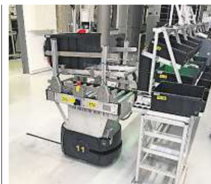
AIV-Systeme sind eine einfach zu integrierende Intralogistiklösung für den Shopfloor.

im AIV-Framework verfügbaren regelbasierten Order Creator. Denn sämtliche Module des AIV-Frameworks haben eine offene „Representational State Transfer (REST)“-Schnittstelle, über die Drittsysteme Informationen einfach abgreifen können. Ebenso simpel gestaltet sich die Einspeisung von Fahraufträgen in das System, nämlich über einen einfachen REST-Call. Sämtliche Abläufe sind konfigurationsbasiert und können somit vom Kunden selbst angepasst und erweitert werden. „Ist dennoch Support gewünscht, stehen unsere Experten dafür jederzeit gern zur Verfügung“, sagt Pammer. „Und wenn ein Hersteller noch nicht über ein vorhandenes Schnittstellenmodul angebunden werden kann, bieten wir auch die Erstellung individueller Schnittstellenmodule an.“ (wz)